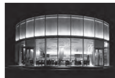
ロイヤルホテル カフェ&バー リバーサイドテラス