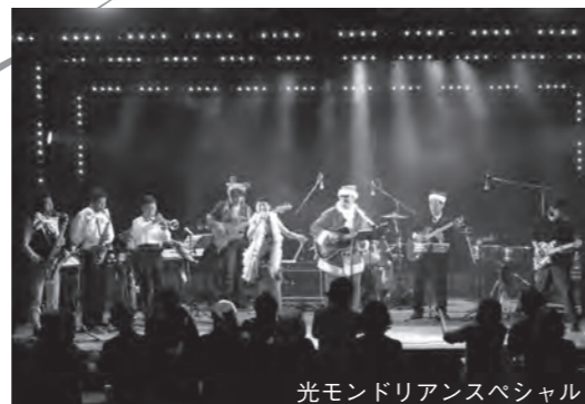
光モンドリアンスペシャル