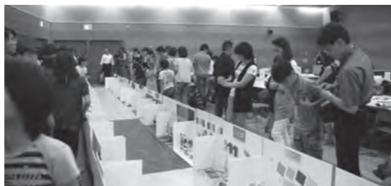
みんなで商店街をつくっている様子