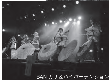
BAN ガサ&ハイパーテンション