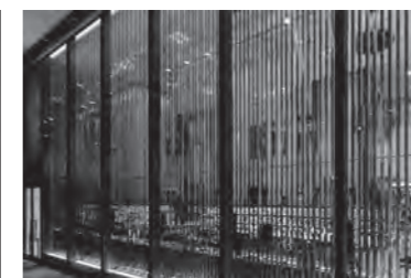
阪急 MEN'S TOKYO