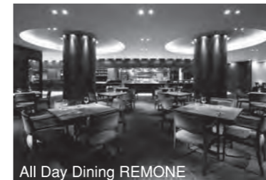
All Day Dining REMONE

レストランを中心にブティック、ホテルなどの幅広い商空間デザインを数多く手掛ける。