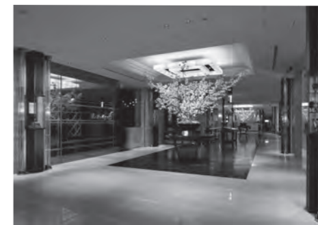
阪神百貨店 梅田本店