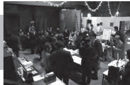
エントランスでは商品紹介や名刺交換が行われました。