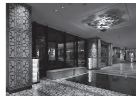
阪神百貨店 梅田本店