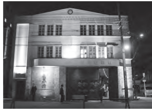
会場外観：Martin will 様のご好意でクリスマスカラーにライトアップ