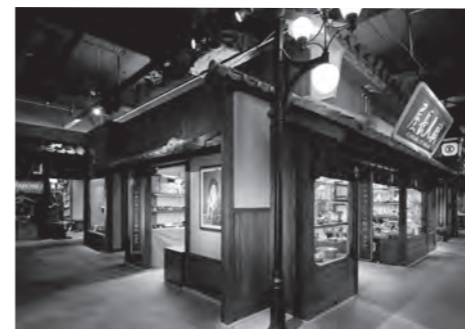
そごう心齋橋店(心齋橋筋商店街)