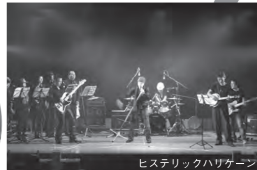
ヒステリックハリケーン