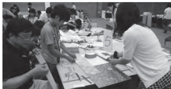
各班でお店の制作をしている様子