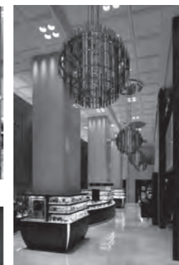
阪急 MEN'S TOKYO